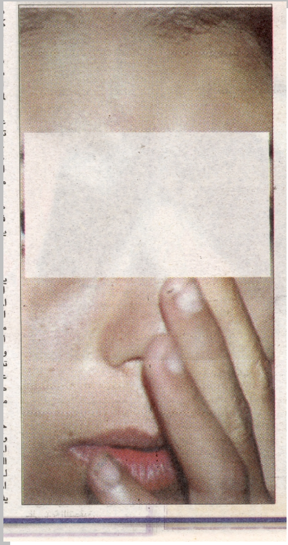
Ausschnitt: Arabische Tageszeitung